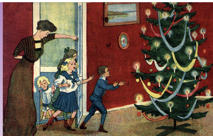
Julekort fra 1920.

Og så var vi onga like fattige att. Det var oppi Svingen dom hadde juleglansen, tenkte vi. Og så gikk vi sakte hematt og ått innmatkaker.