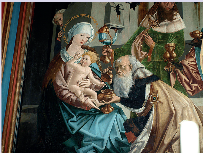
Altertavla fra Mariapfarr kirke.

Det er julekveld i St. Nikolauskirken i den lille landsbyen Oberndorf like utenfor Salzburg i Østerrike. Selve gudstjenesten er over, men før de fremmøtte får gå hjem ved midnatt, skal de få med seg noe på veien, en helt ny julesang.